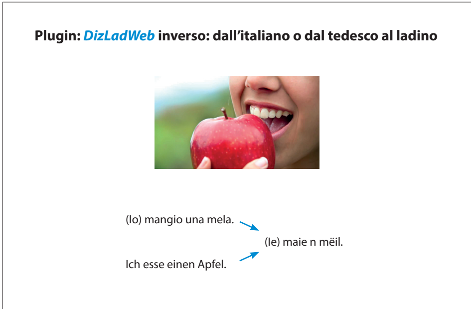
Fig. 4: È in fase di elaborazione il processo di traduzione inverso: partendo da una frase o da un testo italiano o tedesco il plugin è in grado di tradurre i singoli elementi in ladino.